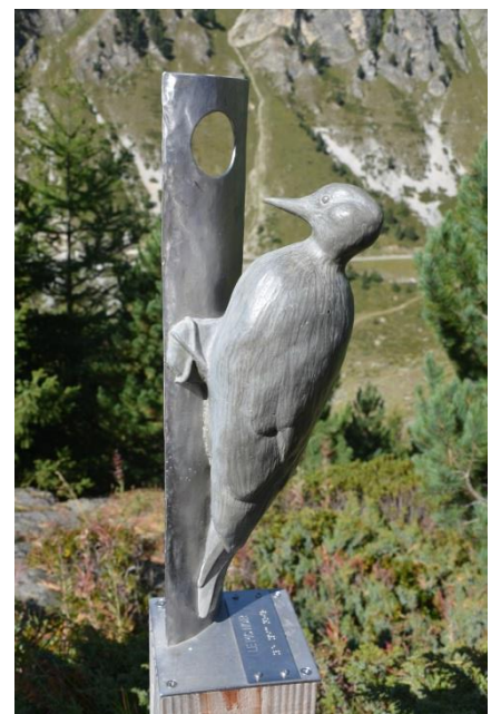
Reproduction d'oiseau, sentier de l'Orgère