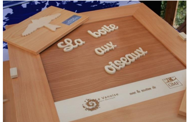
La boîte aux oiseaux

Cet outil de découverte à destination du public déficient visuel a été pensé par le Parc national de la Vanoise afin de compléter par le toucher, des sorties adaptées dans le vallon de l'Orgère , sur la commune de Villarodin-Bourget, sur le thème de la reconnaissance des chants d'oiseaux.